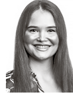
Perkiö Anniina HPP ASIANAJOTOIMISTO OY