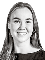
Talso Ella ASIANAJOTOIMISTO CASTRÉN & SNELLMAN OY