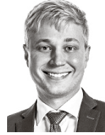
Sukura Mikko ASIANAJOTOIMISTO CASTRÉN & SNELLMAN OY