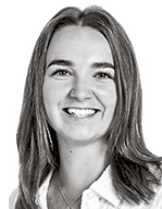
Laamanen Hilma ASIANAJOTOIMISTO CASTRÉN & SNELLMAN OY