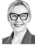
Kiviniemi Katri ASIANAJOTOIMISTO CASTRÉN & SNELLMAN OY