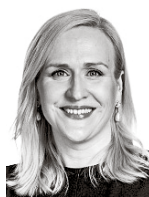
Europaeus Stina ASIANAJOTOIMISTO CASTRÉN & SNELLMAN OY