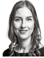
Kannala Viivi ASIANAJOTOIMISTO REIMS & CO OY