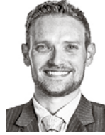
af Schultén Marius ASIANAJOTOIMISTO CASTRÉN & SNELLMAN OY