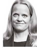
Pekkala Julia HPP ASIANAJOTOIMISTO OY