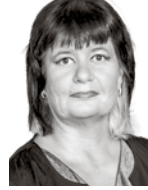
Keskin Minna FINSTA ASIANAJOTOIMISTO OY