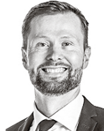
Lusenius Topi ASIANAJOTOIMISTO CASTRÉN & SNELLMAN OY