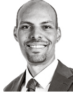
Ogbeide Onni ASIANAJOTOIMISTO CASTRÉN & SNELLMAN OY