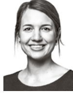
Rindell Mia ASIANAJOTOIMISTO KROGERUS OY