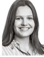
Kallio Oliva HPP ASIANAJOTOIMISTO OY