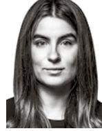
Kiili Inessa ASIANAJOTOIMISTO KROGERUS OY