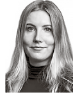
Orvasto Pinja HPP ASIANAJOTOIMISTO OY