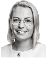
Holm Malin HPP ASIANAJOTOIMISTO OY