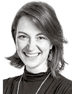
Kuutschin Ani ASIANAJOTOIMISTO CASTRÉN & SNELLMAN OY