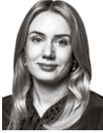
Pihanurmi Janna ASIANAJOTOIMISTO KROGERUS OY