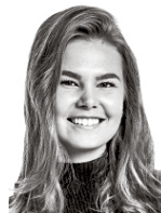
Heino Saga ASIANAJOTOIMISTO CASTRÉN & SNELLMAN OY