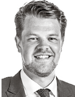
Svento Nicklas ASIANAJOTOIMISTO CASTRÉN & SNELLMAN OY