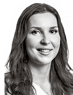
Lahti-Nuutila Aino HPP ASIANAJOTOIMISTO OY