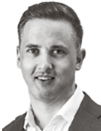
Veneranta Janne LIEKE ASIANAJOTOIMISTO OY