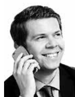
Lustig Mikael HANNES SNELLMAN ASIANAJOTOIMISTO OY