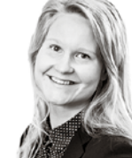
Pitkämäki Netta HANNES SNELLMAN ASIANAJOTOIMISTO OY