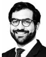
Gomes Ricardo HANNES SNELLMAN ASIANAJOTOIMISTO OY