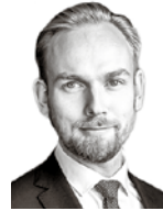
Tyynysiemi Matti HANNES SNELLMAN ASIANAJOTOIMISTO OY