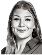
Tanninen Emilia ASIANAJOTOIMISTO CASTRÉN & SNELLMAN OY