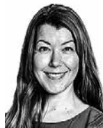
Aaltonen Anu ASIANAJOTOIMISTO CASTRÉN & SNELLMAN OY