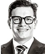
Palomäki Sebastian ASIANAJOTOIMISTO CASTRÉN & SNELLMAN OY