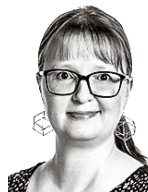
Schmuckli Evelina ASIANAJOTOIMISTO CASTRÉN & SNELLMAN OY