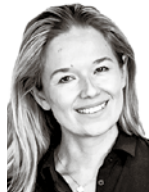
Schauman Annika HANNES SNELLMAN ASIANAJOTOIMISTO OY