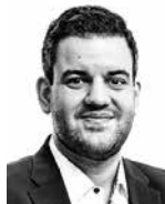
Durac Paul MÄKITALO ASIANAJOTOIMISTO OY