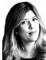
Lefort Ahokanto Carolina HANNES SNELLMAN ASIANAJOTOIMISTO OY