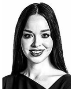
Brisson Iris ASIANAJOTOIMISTO CASTRÉN & SNELLMAN OY