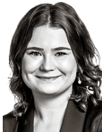
Rossi Vilma ASIANAJOTOIMISTO CASTRÉN & SNELLMAN OY