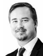
Lumilahti Juuso HANNES SNELLMAN ASIANAJOTOIMISTO OY