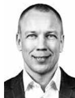
Liijeroos Ilkka ASIANAJOTOIMISTO DLA PIPER FINLAND OY