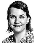
Jalkanen Virve ASIANAJOTOIMISTO CASTRÉN & SNELLMAN OY