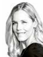
Mäki Tiia HANNES SNELLMAN ASIANAJOTOIMISTO OY