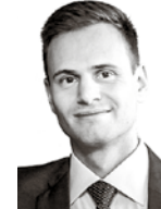
Stellato Stefan HANNES SNELLMAN ASIANAJOTOIMISTO OY