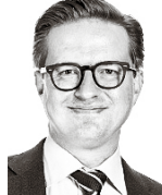
Parviainen Kim ASIANAJOTOIMISTO CASTRÉN & SNELLMAN OY