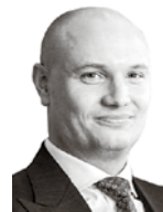
Schröder Vilhelm HANNES SNELLMAN ASIANAJOTOIMISTO OY