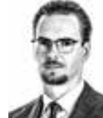
Muurman Markus ASIANAJOTOIMISTO CASTRÉN & SNELLMAN OY