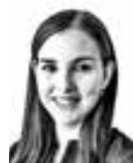
Juureva Johanna ASIANAJOTOIMISTO CASTRÉN & SNELLMAN OY