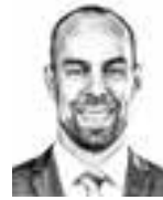
Andersin Jonathan ASIANAJOTOIMISTO DLA PIPER FINLAND OY