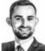
Järvenpää Jesse ASIANAJOTOIMISTO CASTRÉN & SNELLMAN OY