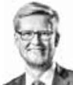
Koto Lassi ASIANAJOTOIMISTO ASTREA OY