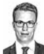
Johansson Niko ASIANAJOTOIMISTO CASTRÉN & SNELLMAN OY