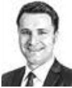
Aakula Aleks ASIANAJOTOIMISTO CASTRÉN & SNELLMAN OY