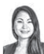
Salmi Susanna ASIANAJOTOIMISTO CASTRÉN & SNELLMAN OY