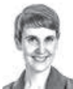
Ollila Marja ASIANAJOTOIMISTO CASTRÉN & SNELLMAN OY