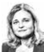
Krook Åsa ASIANAJOTOIMISTO WASELIUS & WIST OY