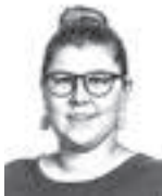
Sillanmäki Anu ASIANAJOTOIMISTO CASTRÉN & SNELLMAN OY