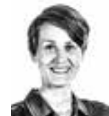
Nieminen Jutta ASIANAJOTOIMISTO CASTRÉN & SNELLMAN OY