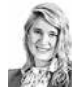
Carpelan Isabel ASIANAJOTOIMISTO CASTRÉN & SNELLMAN OY