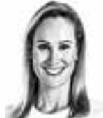
Lång Mina ASIANAJOTOIMISTO CASTRÉN & SNELLMAN OY