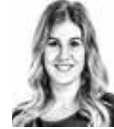
Collin Sara ASIANAJOTOIMISTO CASTRÉN & SNELLMAN OY