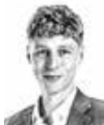
Gestrin Oskari ASIANAJOTOIMISTO CASTRÉN & SNELLMAN OY