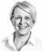
Aalto Maria ASIANAJOTOIMISTO CASTRÉN & SNELLMAN OY