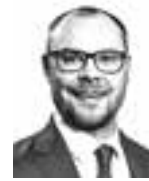
Björndahl Oskar KOTKA & CO. ASIANAJOTOIMISTO OY