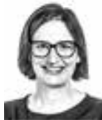
Kössi Sini ASIANAJOTOIMISTO CASTRÉN & SNELLMAN OY