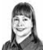
Knuuti Reeta ASIANAJOTOIMISTO CASTRÉN & SNELLMAN OY