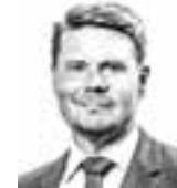
Kiuru Olli ASIANAJOTOIMISTO WASELIUS & WIST OY