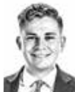
Honkala Jaakko ASIANAJOTOIMISTO CASTRÉN & SNELLMAN OY