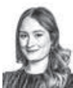
Sivonen Ella ASIANAJOTOIMISTO CASTRÉN & SNELLMAN OY