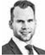
Korhonen Erkki HANNES SNELLMAN ASIANAJOTOIMISTO OY