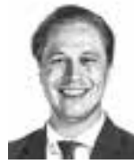
Jämsä Juhani ASIANAJOTOIMISTO CASTRÉN & SNELLMAN OY