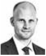
Hellgren Juhani ASIANAJOTOIMISTO CASTRÉN & SNELLMAN OY