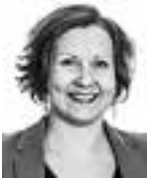
Karvinen Kiti ASIANAJOTOIMISTO CASTRÉN & SNELLMAN OY