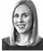
Sarkio Hanna FRONTIA ASIANAJOTOIMISTO OY