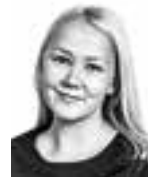
Raappana Piia ASIANAJOTOIMISTO CASTRÉN & SNELLMAN OY