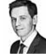
Veranen Olli-Pekka HANNES SNELLMAN ASIANAJOTOIMISTO OY