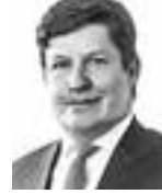
Wahlbeck Mikael FRONTIA ASIANAJOTOIMISTO OY