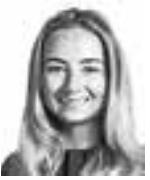
Yildiz Deniz ASIANAJOTOIMISTO CASTRÉN & SNELLMAN OY