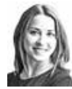
Kartila Isabella HANNES SNELLMAN ASIANAJOTOIMISTO OY