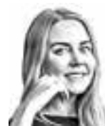
Rinne Ella HANNES SNELLMAN ASIANAJOTOIMISTO OY