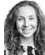
Lahti Hanna ASIANAJOTOIMISTO LINDBLAD & CO OY