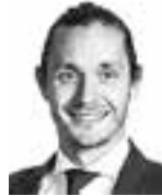
Korpiola Sampo ASIANAJOTOIMISTO CASTRÉN & SNELLMAN OY