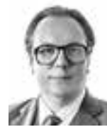
Talvitie Jussi FRONTIA ASIANAJOTOIMISTO OY