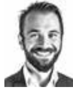
Slotte Andreas ASIANAJOTOIMISTO CASTRÉN & SNELLMAN OY