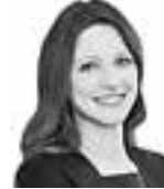
Laakso Paula HANNES SNELLMAN ASIANAJOTOIMISTO OY