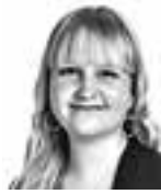
Toskala Sini ASIANAJOTOIMISTO CASTRÉN & SNELLMAN OY