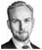
Tyynysiemi Matti HANNES SNELLMAN ASIANAJOTOIMISTO OY