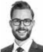
Ollus Robin ASIANAJOTOIMISTO CASTRÉN & SNELLMAN OY