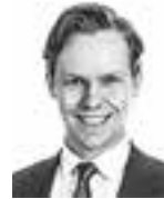
Lagus Julian ASIANAJOTOIMISTO CASTRÉN & SNELLMAN OY