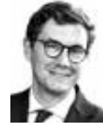
Toponen Antti HANNES SNELLMAN ASIANAJOTOIMISTO OY