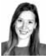
Leivo Jutta ASIANAJOTOIMISTO CASTRÉN & SNELLMAN OY