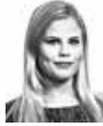
Iso-Markku Outi HPP ASIANAJOTOIMISTO OY