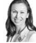
Wasastjerna Maria HANNES SNELLMAN ASIANAJOTOIMISTO OY