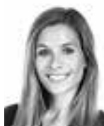
Pensar Alexandra ASIANAJOTOIMISTO CASTRÉN & SNELLMAN OY