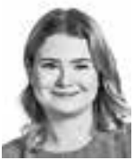
Rossi Vilma ASIANAJOTOIMISTO CASTRÉN & SNELLMAN OY