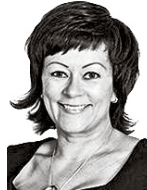
Viro Outi ASIANAJOTOIMISTO CASTRÉN & SNELLMAN OY