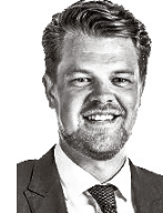
Svento Nicklas ASIANAJOTOIMISTO CASTRÉN & SNELLMAN OY