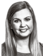
Sandholm Ida HPP ASIANAJOTOIMISTO OY