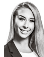
Savander-Elivuo Monica I&O PARTNERS ASIANAJOTOIMISTO OY