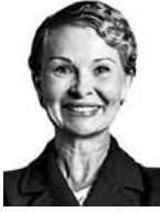
Huomo Laura BIRD & BIRD ASIANAJOTOIMISTO OY