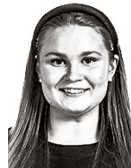
Rautanen Aino ASIANAJOTOIMISTO CASTRÉN & SNELLMAN OY