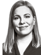
Sautny Emmi HPP ASIANAJOTOIMISTO OY