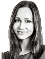
Valtanen Viola ASIANAJOTOIMISTO CASTRÉN & SNELLMAN OY