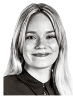
Lyrra Sofia ASIANAJOTOIMISTO CASTRÉN & SNELLMAN OY