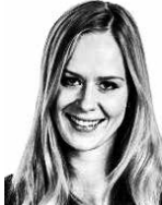
Kimari Laura ASIANAJOTOIMISTO CASTRÉN & SNELLMAN OY