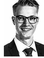
Kauppi Niko ASIANAJOTOIMISTO CASTRÉN & SNELLMAN OY