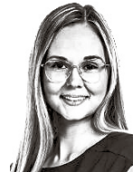
Ylitalo Veera ASIANAJOTOIMISTO CASTRÉN & SNELLMAN OY