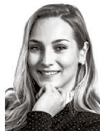
Sandvik Henrietta ASIANAJOTOIMISTO LUKANDER RUOHOLA HTO OY