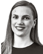
Montonen Alisa MÄKITALO ASIANAJOTOIMISTO OY