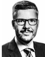
Baarman Pontus I&O PARTNERS ASIANAJOTOIMISTO OY