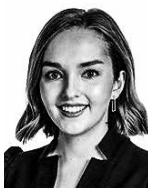
Alahuita Anna-Sofia ASIANAJOTOIMISTO CASTRÉN & SNELLMAN OY