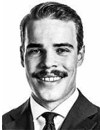
Koivu Onni ASIANAJOTOIMISTO CASTRÉN & SNELLMAN OY