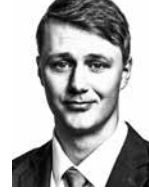
Kananen Jarno ASIANAJOTOIMISTO LUKKARI LYTYINEN HELMINEN OY