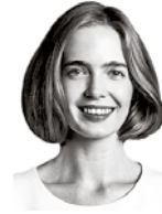
Melin Marla BIRD & BIRD ASIANAJOTOIMISTO OY