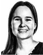
Kurvi Tiina ASIANAJOTOIMISTO CASTRÉN & SNELLMAN OY