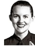
Mittler Cea BIRD & BIRD ASIANAJOTOIMISTO OY