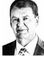
Itäinen Leif I&O PARTNERS ASIANAJOTOIMISTO OY