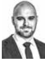
Jalo Valtteri HPP ASIANAJOTOIMISTO OY