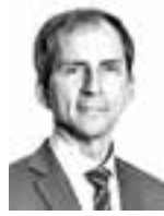
Klemettilä Jaakko HPP ASIANAJOTOIMISTO OY