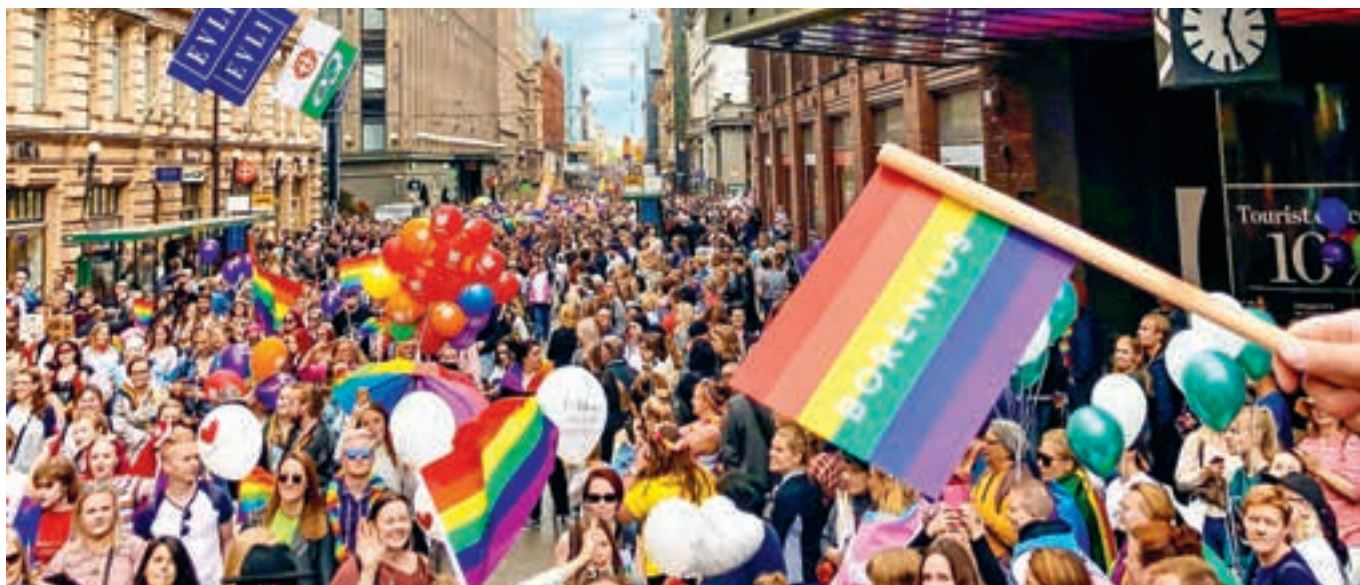
Borenius osallistui Pride-kulkueseen 2019. Tänä vuonna Helsinki Pride pidettiin koronatilanteen vuoksi hybriditapahtumana, eikä perinteistä kulkueita järjestetty.