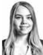
Oesch Sofia BIRD & BIRD ASIANAJOTOIMISTO OY