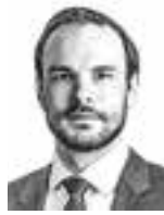
Degerholm Emil HPP ASIANAJOTOIMISTO OY