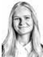
Rein Johanna BIRD & BIRD ASIANAJOTOIMISTO OY