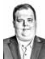
Vikström Matias BIRD & BIRD ASIANAJOTOIMISTO OY