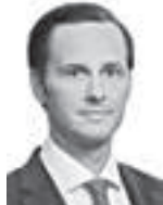
Majamäki Klaus HPP ASIANAJOTOIMISTO OY