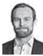
Pyy Juuso ASIANAJOTOIMISTO BIRD & BIRD OY