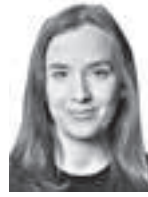
Rantanen Iiris ASIANAJOTOIMISTO KROGERUS OY