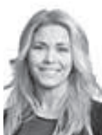
Esala Emilia HPP ASIANAJOTOIMISTO OY