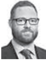
Sandvik Risto HPP ASIANAJOTOIMISTO OY