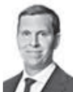
Lassila Samu ASIANAJOTOIMISTO KROGERUS OY