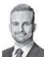
Alm Didier ASIANAJOTOIMISTO KROGERUS OY