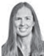
Lind Mikaela HPP ASIANAJOTOIMISTO OY