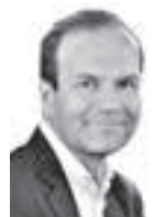
Ikonen Jussi ASIANAJOTOIMISTO MERILAMPI OY