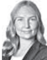
Kallio Lila ASIANAJOTOIMISTO KROGERUS OY