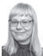
Arkia Noora ASIANAJOTOIMISTO MERILAMPI OY