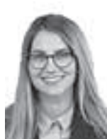
Holck Auriina ASIANAJOTOIMISTO DLA PIPER FINLAND OY