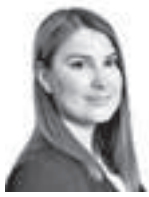
Pahta Kerttu ASIANAJOTOIMISTO MAKITALO RANTANEN OY