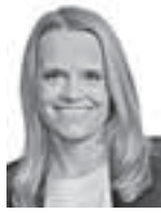
Pekkala Julia HPP ASIANAJOTOIMISTO OY