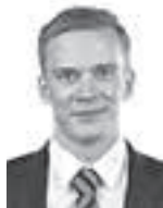
Kauma Juha ASIANAJOTOIMISTO DLA PIPER FINLAND OY