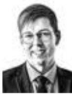
Ojakoski Risto HANNES SNELLMAN ASIANAJOTOIMISTO OY