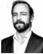
Autio Simo ASIANAJOTOIMISTO KROGERUS OY