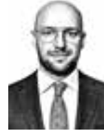
Raade Paul PROPERTA ASIANAJOTOIMISTO KROGERUS OY