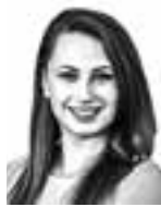
Männistö Milla HANNES SNELLMAN ASIANAJOTOIMISTO OY