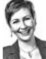
Ropo Mirja ASIANAJOTOIMISTO LUKANDER RUOHOLA HTO OY