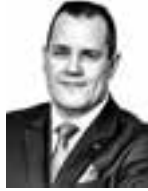
Arnamo Petri ASIANAJOTOIMISTO LUKANDER RUOHOLA HTO OY