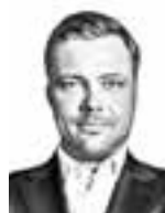
Riski Lasse ASIANAJOTOIMISTO BIRD & BIRD OY