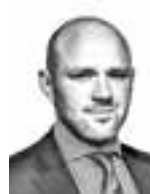
Welling Niki J. BORENIUS ASIANAJOTOIMISTO OY