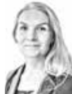
Talvinko Tuuli ASIANAJOTOIMISTO SOTAMAA & CO OY