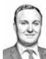
Isoaho Olli BORENIUS ASIANAJOTOIMISTO OY