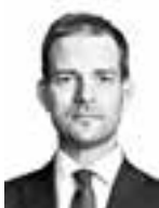
Kärki Eero ASIANAJOTOIMISTO BIRD & BIRD OY