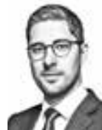
Jakobsson Niko BORENIUS ASIANAJOTOIMISTO OY