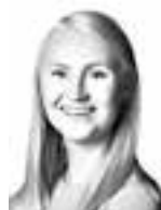
Tuure Laura ASIANAJOTOIMISTO KROGERUS OY