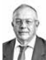
Malka Ilkka FINSTA ASIANAJOTOIMISTO OY