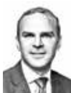
Kolster Thomas ASIANAJOTOIMISTO KROGERUS OY