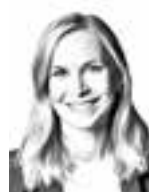
Niitynpää Essi ASIANAJOTOIMISTO KROGERUS OY