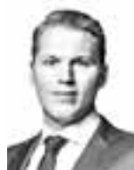
Laine Markus ASIANAJOTOIMISTO KROGERUS OY