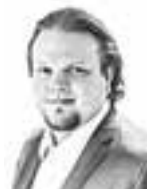
Castrén Lalli ASIANAJOTOIMISTO SOTAMAA & CO OY