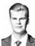
Viherkenttä Julius ASIANAJOTOIMISTO KROGERUS OY